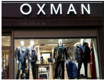
un magasin de vêtements