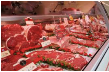
de la viande