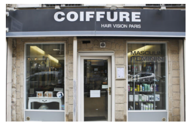
un salon de coiffure