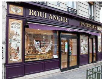
une boulangerie/une pâtisserie