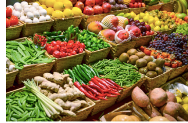
des fruits, des légumes