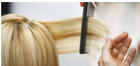
couper les cheveux